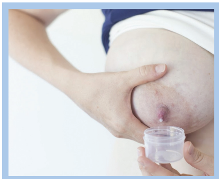
Ekstrè manyèl manman fè