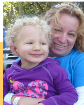
Escuchar música a Sertoma Youth Ranch con sus 2 orejas "especiales".