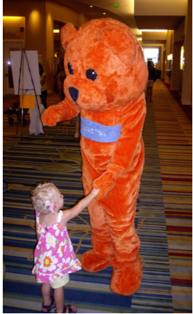
Kiersta en el 2012 Family Cafe

Interesado en asistir a una conferencia, taller o grupo de juego?